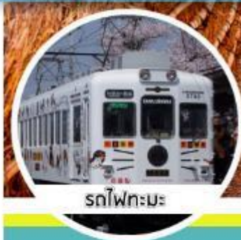
รถไฟทอมะ

ราคาเดียวทุกปีเรียด มิถุนายน - กันยายน 62