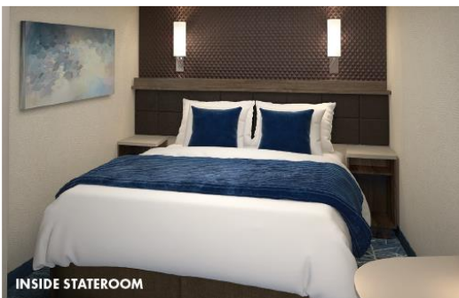
ห้องพักแบบไม่มีหน้าต่าง (Inside cabin) : ขนาด 135 sq.ft